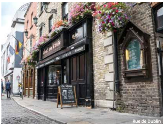
Rue de Dublin