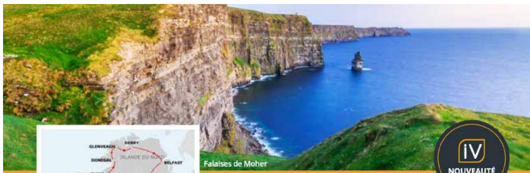
Falaises de Moher