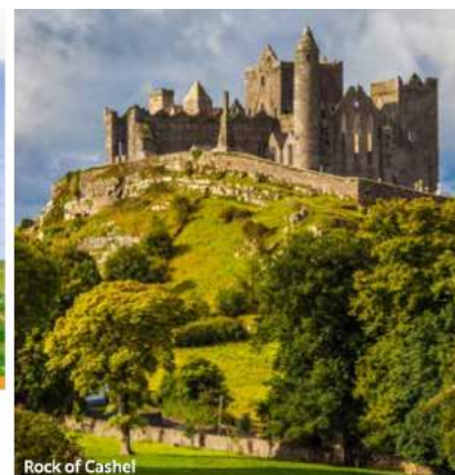
Rock of Cashel