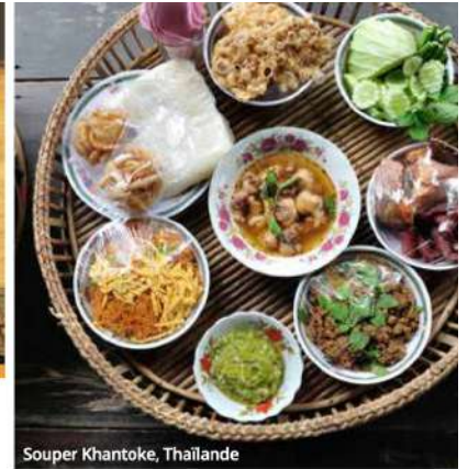
Souper Khantoke, Thaïlande