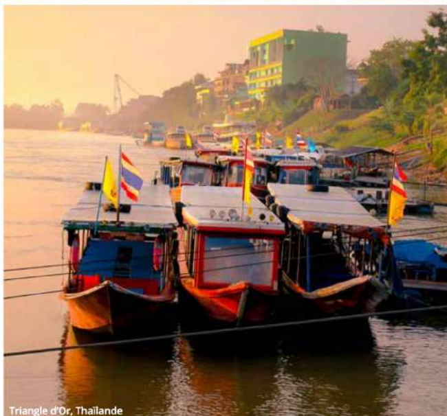
Triangle d'Or, Thaïlande

Après le petit déjeuner, départ pour Bangkok. Vous aurez l'après-midi libre pour faire vos derniers achats. Des chambres seront mises à votre disposition si vous souhaitez vous reposer. Souper d'adieu et transfert pour les vols de retour vers Montréal. (PD/S)