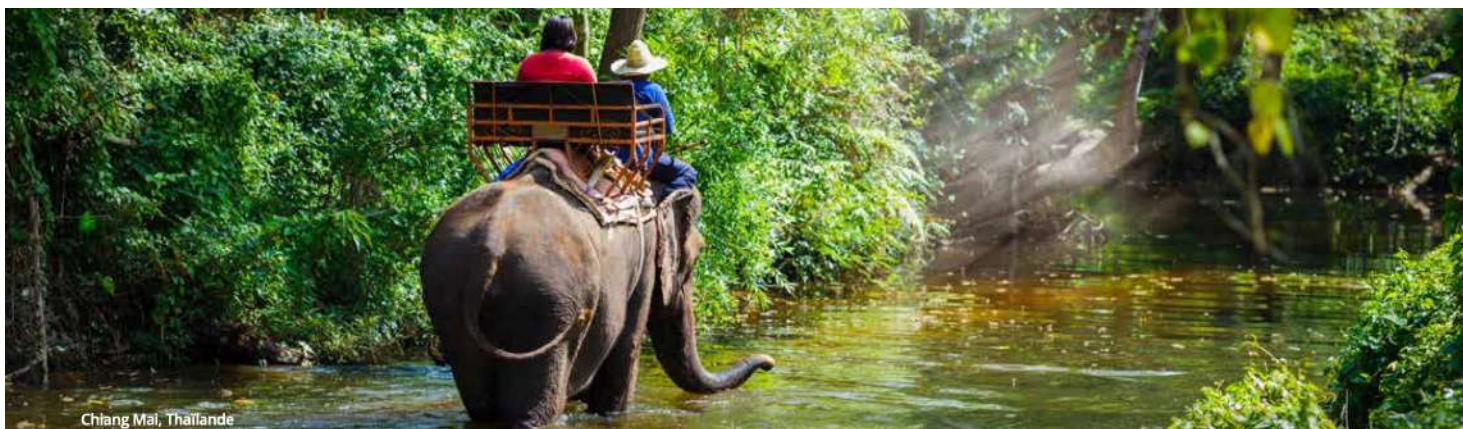
Chiang Mai, Thaïlande

spectacle de danse des tribus du Nord. Nuit à Chiang Mai. (PD/D/S)