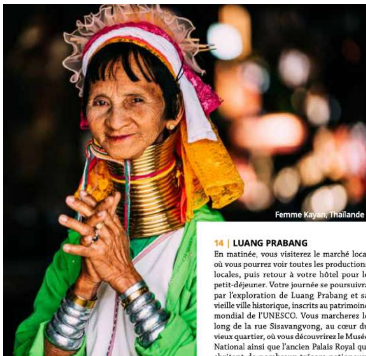
Femme Kayan, Thaïlande