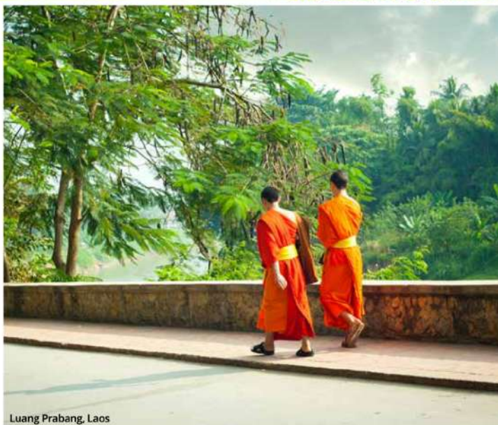
Luang Prabang, Laos

Poursuite de la croisière en descendant le Mékong jusqu'à Luang Prabang. Visite d'un village qui borde le fleuve, si le niveau de l'eau le permet. Dîner à bord du bateau. En cours de descente, vous ferez un arrêt pour visiter les grottes sacrées de Pak Ou, avec ses milliers de statuettes de Bouddha et offrant un point de vue magnifique sur le Mékong. Arrivée à Luang Prabang, ancienne capitale royale, qui est classée au Patrimoine Mondial de l'humanité par l'UNESCO. Souper au restaurant et nuit à l'hôtel. (PD/D/S)