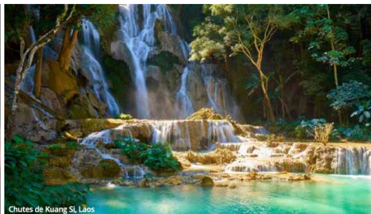
Chutes de Kuang Si, Laos