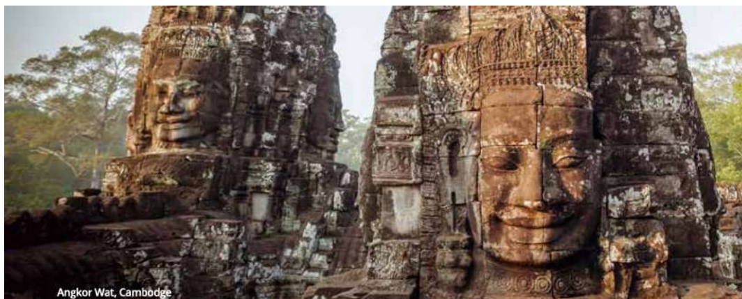
Angkor Wat, Cambodge

Le coucher du soleil et découvrir la vie nocturne du bourg. Souper dans un restaurant local avec spectacle de danse. Nuit à l'hôtel. (PD/D/S)